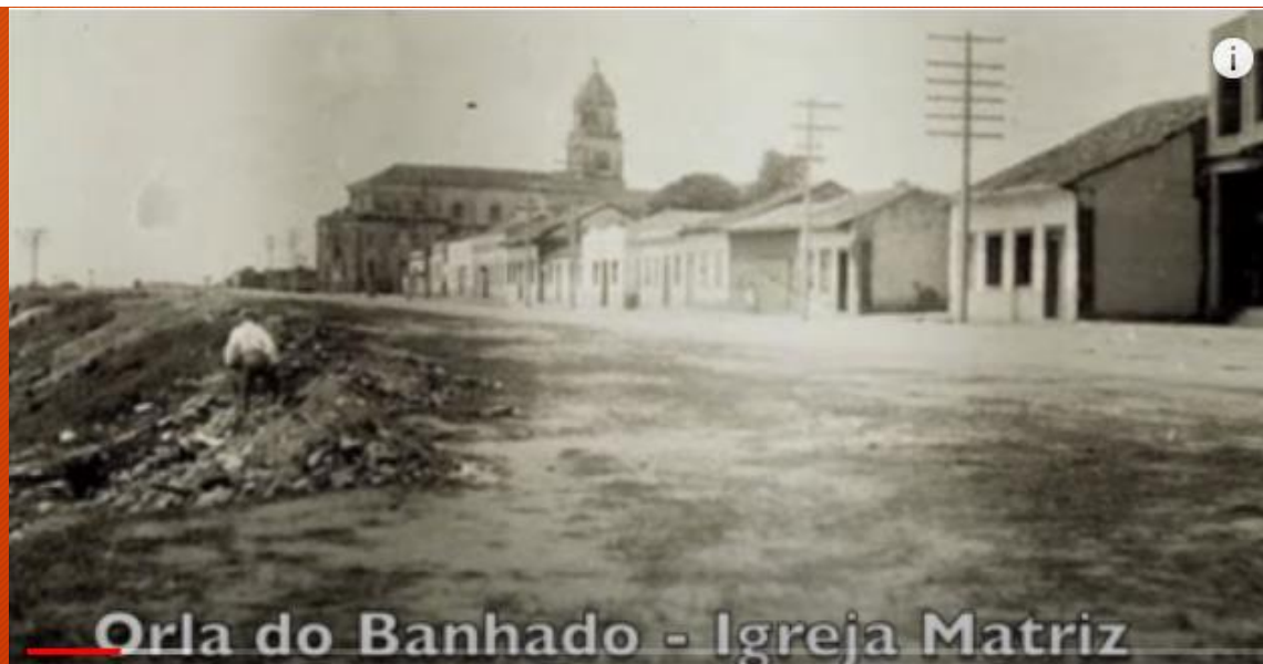
Orla do Banhado - Igreja Matriz

Agradecimentos ao historiador Douglas Almeida, ao Repórter Cinematográfico Jorge Silva, à TV Univap e ao Cehvap - Centro de História e Memória da Univap.